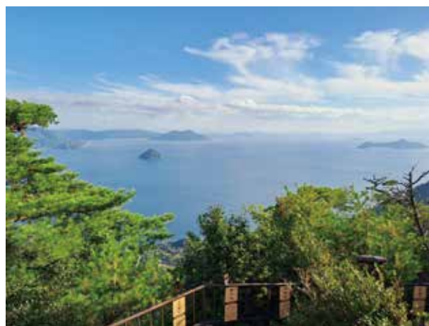
圖五 宮島瀨山獅子岩遠眺瀨戶內海

此次廣島之行除了參加國際會議交流學習，也有機會造訪了幾處世界文化遺產及著名的景點，收穫滿滿。廣島如果從新大阪搭乘新幹線，不到2小時即可抵達，下次大家如果要到大阪自由行，也可以考慮那些時間造訪廣島！✚