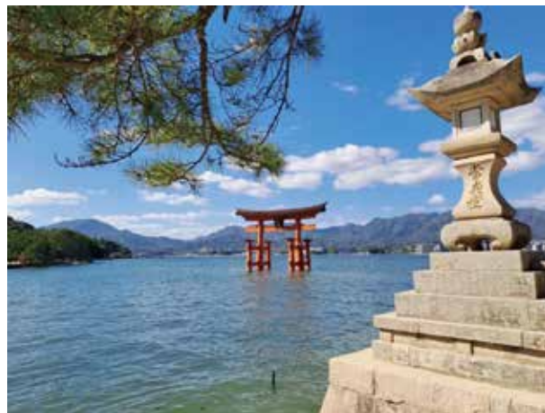
圖四 矗立在海上的大鳥居