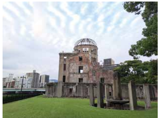
圖二 廣島和平公園原爆圓頂館

廣島位於日本本州島的西部，面對瀨戶內海，由於台灣直飛廣島的班機較少，因此我們由大阪進出。此次我們購買日本JR PASS關西&廣島地區鐵路周遊券，由關西新大阪搭乘新幹線到廣島，此票券可無限次搭乘山陽新幹線（新大阪-廣島）、機場特急列車、JR西日本快車及JR宮島渡輪，非常方便實用。廣島國際會議中心位於和平紀念公園內，和平紀念公園是位於廣島市中心的一座大型公園，在原子彈爆炸震央附近建造的，園內有被登入為世界遺產的原爆圓頂館、展示原子彈投下時廣島狀況的和平紀念資料館、原子彈死難者紀念碑、和平鐘等。原爆圓頂館距離1945年8月6日的爆炸中心僅160公尺的位置，當時在裡面的人全部罹難，但建築物的骨架與牆壁卻奇跡似的殘留下來，經過多次的修復工程維持現在的外觀，