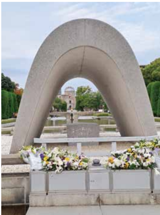
圖一 廣島和平公園原子彈死難者紀念碑

2024年11月初代表醫院到日本廣島領取全球無菸健康照護服務網絡（Global Network for Tobacco Free Healthcare Services；簡稱GNTH）無菸醫院國際金獎，並在「全球網絡研討會暨金獎論壇」分享醫院戒菸特色。2024無菸醫院國際金獎全球共有15家醫院獲獎，其中台灣推薦參加的8家醫院全數榮獲國際金獎殊榮，每家醫院各有特色，分享內容涵蓋透過多媒體互動、醫病共享決策等創新措施，提升戒菸服務品質，並推廣無菸環境及社區參與，展現卓越的戒菸成效。此次的金獎論壇與第30屆International conference on Health Promoting Hospitals and Health Services一起在廣島的國際會議中心舉辦，會議主題是The contribution of Health Promoting Hospitals and